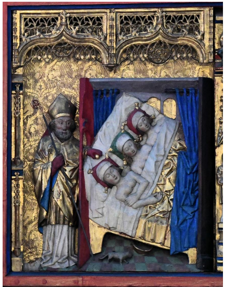
Hl. Nikolaus, Hochaltar Minoritenkirche Köln