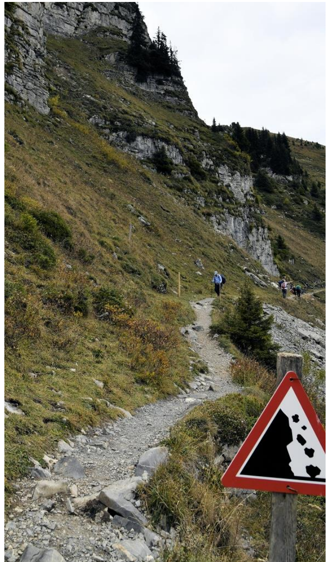
Schnyige Platte, Schweiz

„Nirgends ist ein Prophet ohne Ansehen außer in seiner Heimat.“