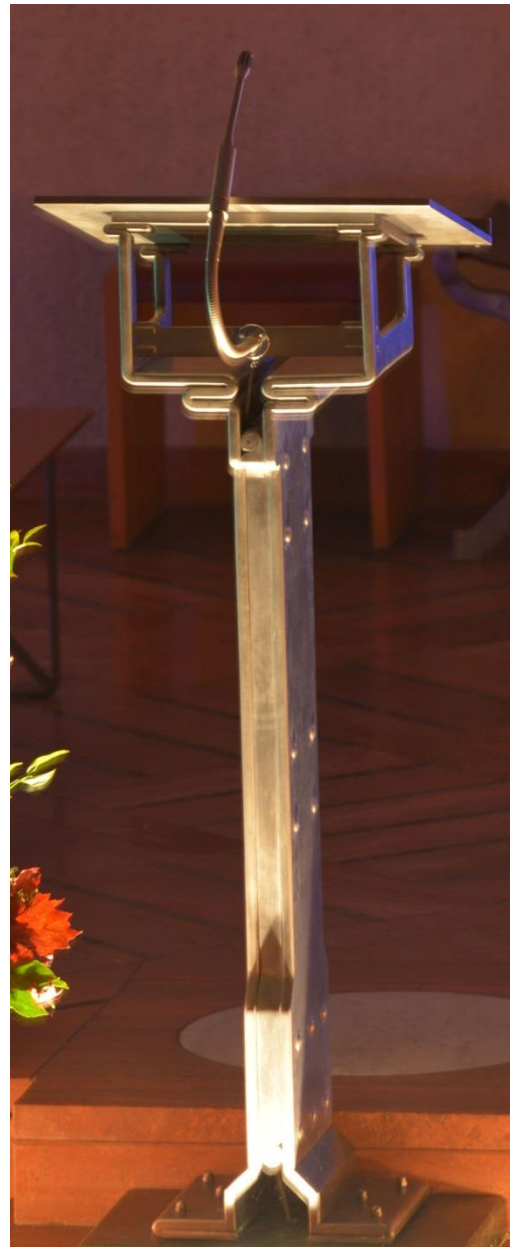
St. Marien Bad Lippspringe