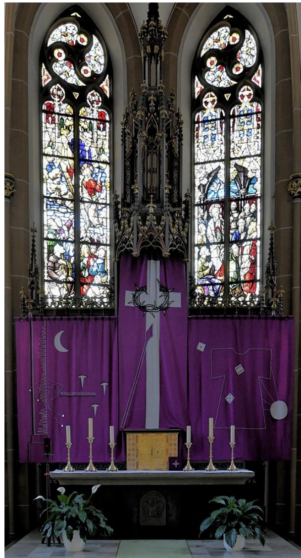
Heilig Kreuz Altenbeken, Foto Bernhard Bauer

„Wenn das Weizenkorn in die Erde fällt und stirbt, bringt es reiche Frucht.“