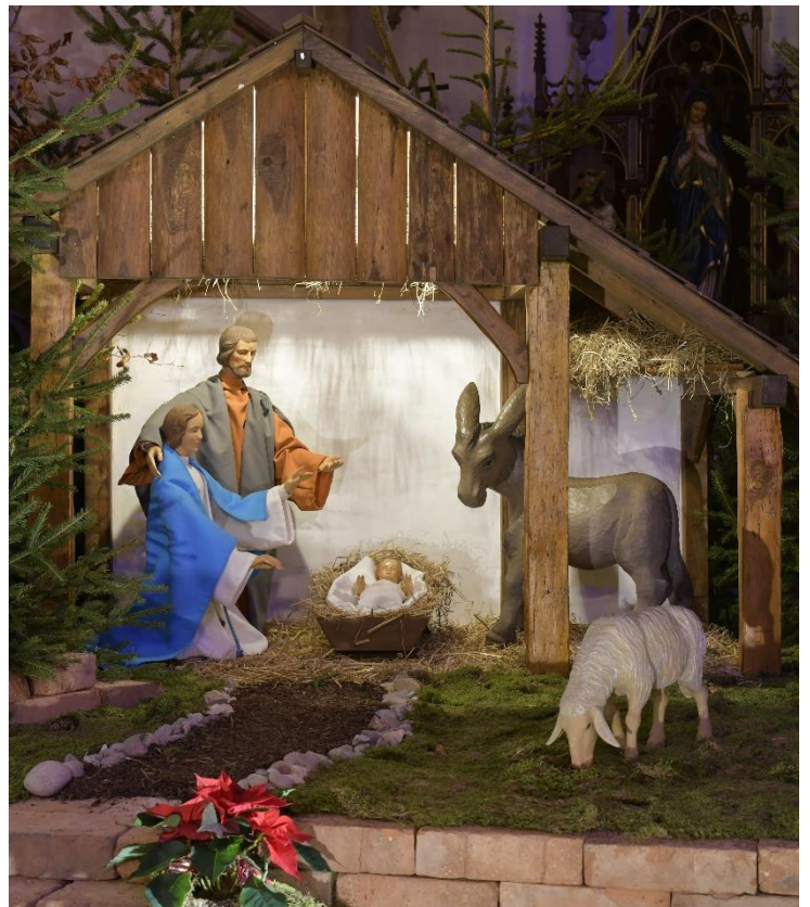
St. Johannes Baptist Schwaney

Ich wünsche Ihnen eine gesegnete Weihnacht, Ihr Pfarrer Georg Kersting