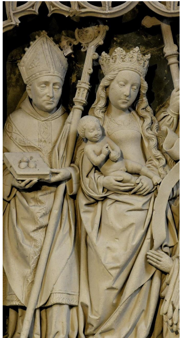
Hl. Liborius, Kreuzgang im Dom zu Paderborn

„Sie waren wie Schafe, die keinen Hirten haben.“