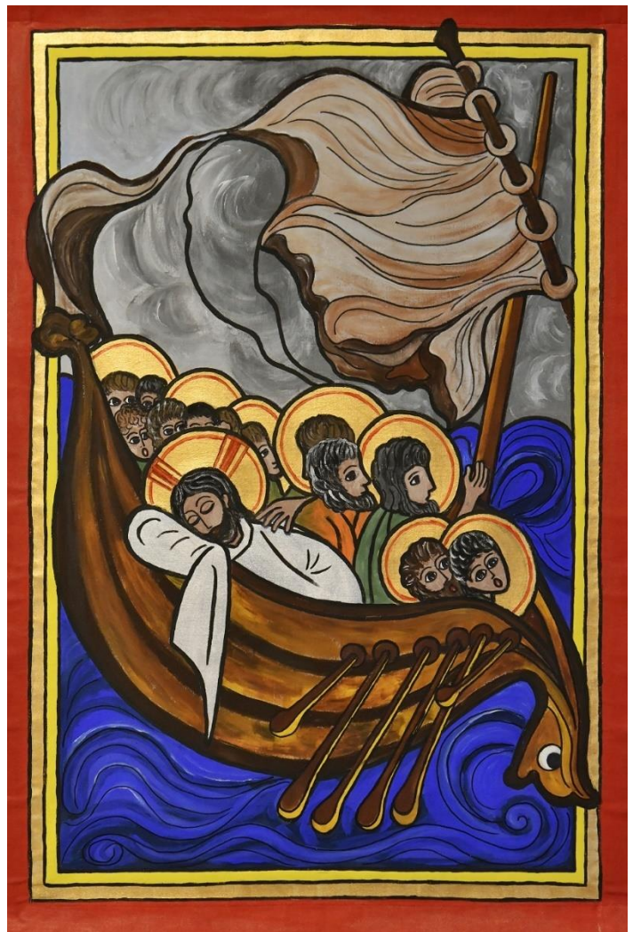
Sturm auf dem Meer, Batik Sr. Matthäa Massole; Foto Bernhard Bauer

„Wer ist denn dieser, dass ihm sogar der Wind und der See gehorchen?“