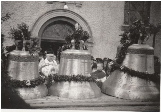
Weihe der Glocken am Palmsonntag, 21. März 1937; Pfarrarchiv Marienloh

Am 4. Mai werden in Marienloh keine Kirchenglocken zu hören sein. Sie sind nicht defekt, sondern sie läuten nicht, um an ein trauriges Ereignis zu erinnern: Vor 80 Jahren, am 4. Mai 1942, wurden die beiden größten Glocken abmontiert, weil sie im Rahmen der „Metallspende des deutschen Volkes“ für die Rüstungsindustrie des NS-Regimes eingeschmolzen werden sollten. Dabei waren sie erst 5 Jahre zuvor, also 1937, gegossen und geweiht worden. Die Glocken wurden zu einem so genannten „Glockenfriedhof“ in Lünen bei Dortmund gebracht. Zum Glück ging der Krieg zu Ende, bevor sie eingeschmolzen wurden. Zwei Bauern aus der Gemeinde haben sie 1947 mit einem Trecker von dort zurückgeholt. Die Gemeinde St. Joseph Marienloh wird im kommenden Sommer mit einem Vortragsabend und einem „Glockenkonzert“ an diese Ereignisse erinnern.