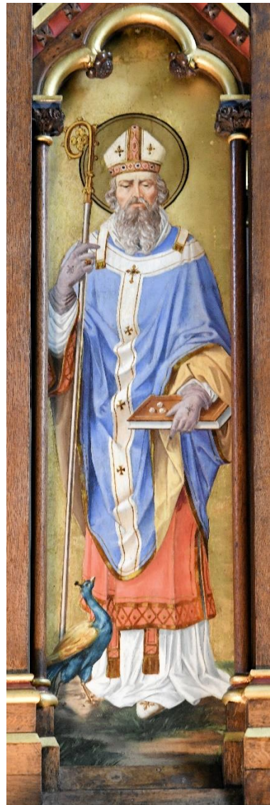
Hl. Liborius im Hochaltar St. Marien Neuenbeken