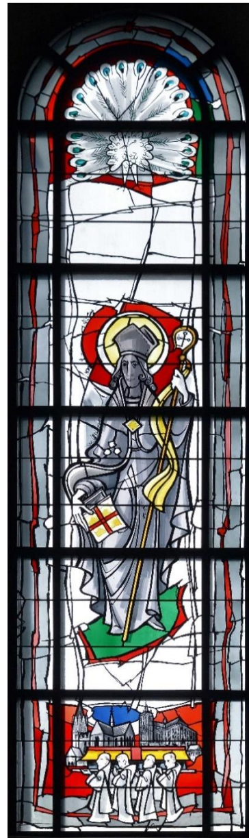
Kirchenfenster Hl. Liborius, St. Jakobus Winterberg

„Jesus teilte an die Leute aus, so viel sie wollten.“