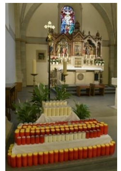
St. Marien Neuenbeken

Die Gottesdienstbesucherinnen und -besucher sind eingeladen, auch ihre eigenen Kerzen zu den Gottesdiensten mit Kerzenweihe mitzubringen.