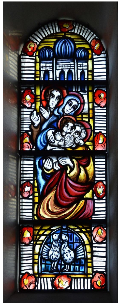
St. Joseph Marienloh

„Wie Elija und Elischa ist Jesus nicht nur zu den Juden gesandt.“