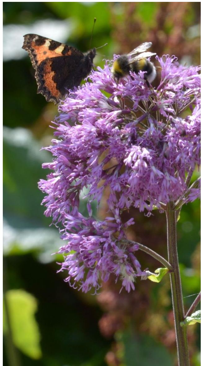
Blüte mit Insekten