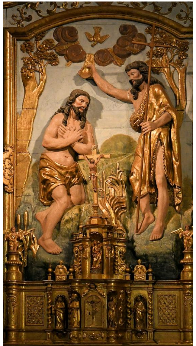
Pfarrkirche in Bartres bei Lourdes

„Das Wort ist Fleisch geworden und hat unter uns gewohnt.“