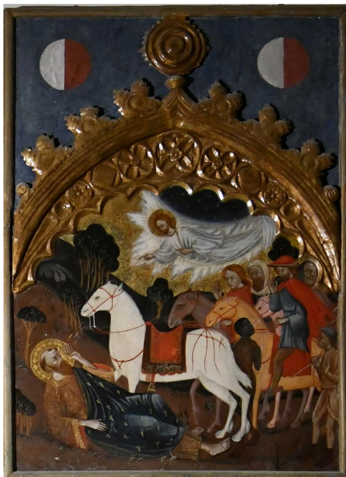
Ausschnitt aus einem Paulus-Altar im Museum an der Kathedrale in Mdina auf Malta

„ Seht, das Lamm Gottes, das die Sünde der Welt hinwegnimmt. “