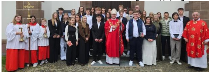
Firmung Bad Lippspringe, 15:00