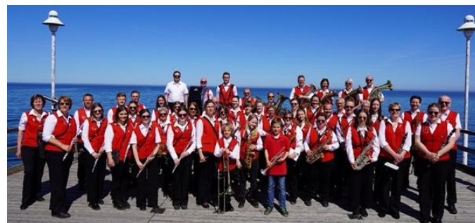
Gruppenbild aller Musikerinnen und Musiker auf der Vinetabrücke im Ostseebad Zinnowitz

Der Kolping-Musikverein Bad Lippspringe blickt auf eine rundum gelungene Konzertreise zurück, die allen Beteiligten noch lange in Erinnerung bleiben wird.