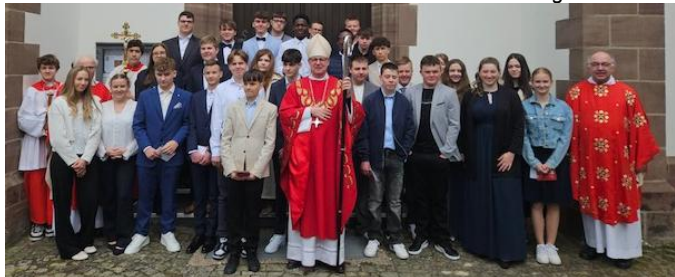
Firmung Bad Lippspringe 10:00