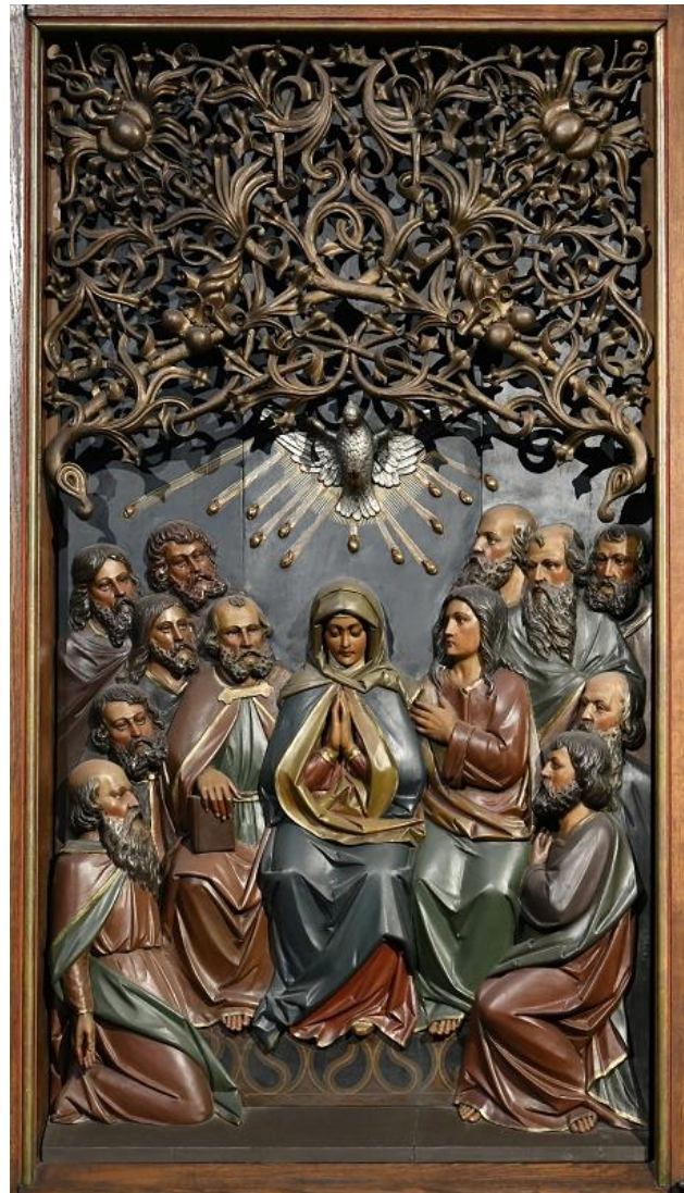
Marienaltar Gaukirche Paderborn

„Wie mich der Vater gesandt hat, so sende ich euch: Empfangt den Heiligen Geist!“